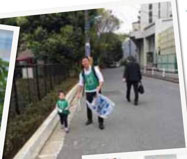
◀地域の清掃活動に娘と参加。自分たちが住む街をもっとキレイで、もっとカッコイイ街にする。“KEEP CLEAN, KEEP GREEN”