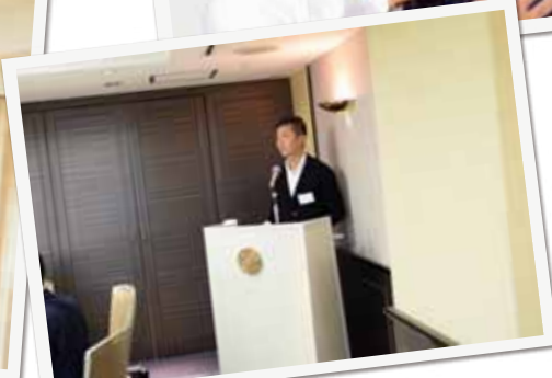
▲経営者が切磋琢磨する経営同友会で司会を行いました。超党派で日本のこれからのを考える、50年以上続く勉強会です。