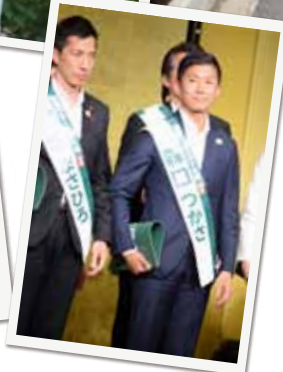
▲都民ファーストの会総決起大会にて。