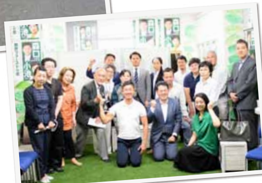
▲新宿に住み暮らす皆さんと対話集会。命を守る街づくり、安全安全の取り組み、災害対策について意見交換。