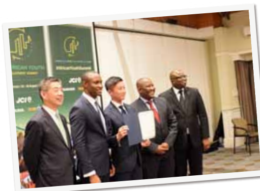
▲ケニアの首都ナイロビにて、アフリカの開発をテーマとする国際会議(TICAD VI)サイドイベントに参加。日本としてどのような国際貢献が出来るか、アフリカの青年達とディスカッション。

シニアがもっと元気に働き、社会で活躍できる場を創出。地域医療・介護サービスを充実させ、高齢者の健康長寿を推進します。