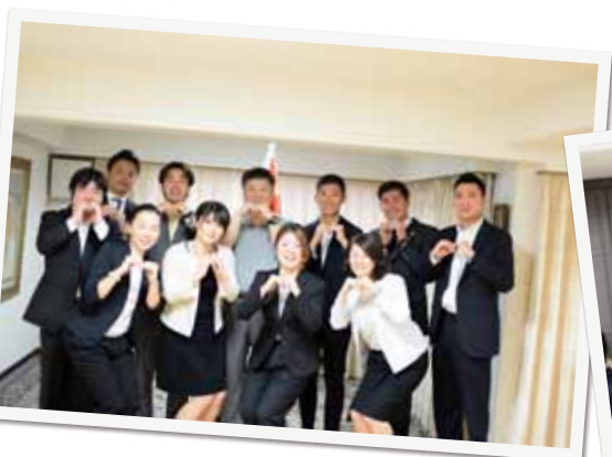
▲モンゴル大使館にて、モンゴルの文化・経済的の勉強会を開催。2020年オリンピック・パラリンピック開催に向けて、国際交流、文化交流を推進!